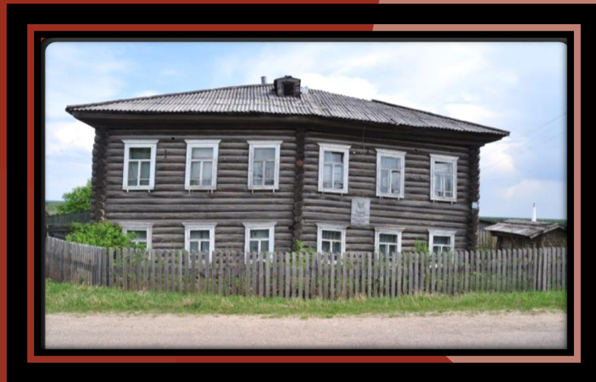
• Дом Г. Ф. Тимушева