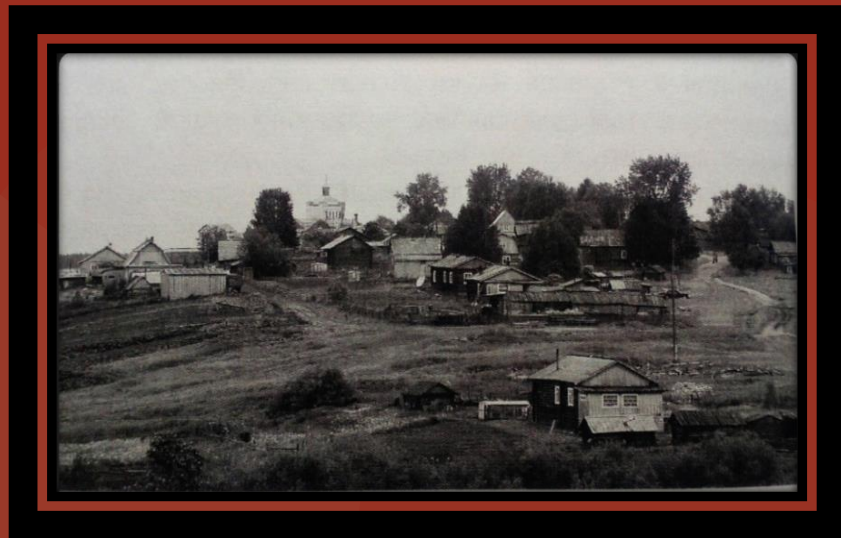
• Деревня Усть-Нем